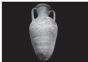
נבל יין מהתקופה הרומית

כז וַתֹּאמֶר חַנָּה לְעַלֵי: בִּי, בְּבִקְשָׁה, אֲדַנִּי! חֵי נַפְשֵׁךְ, אֲדַנִּי! אֲנִי אוֹתָהּ הָאִשָּׁה הַנְּעֻצָּת, שֶׁעֲמָדָה עִמָּכָה, עִמָּךְ בָּזָה לְהַתְּפִיל אֶל ה'. בְּעֵבֶר חַנָּה לֹא סִיפְרָה לּוֹ מֵה בִיקְשָׁה. עֲכָשִׁיו הִיא מִגְּלָה לּוֹ: כז אֶל הַנְּעָר הַזֶּה הַתְּפִלְלָתִי, וַיִּתֵּן ה' לִי אֶת שְׂאֵלָתִי אֲשֶׁר שְׂאֵלְתִי מֵעֵמוֹ. כח וּמִכִּיוּן שֶׁה' מִילָא אֶת מִשְׂאֵלְתִי, הִרִי גַם אֲנֹכִי הַשְּׂאֵלְתָהּ, כְּחֶלֶק מִהַמִּשְׂאֵלָה שֶׁלִּי לֵה'. כָּל הַיָּמִים אֲשֶׁר הִיָּה, יִהְיֶה בְּעוֹלָם - הוּא שְׂאוֹל, מִסוּר וְנִתּוֹן לֵה'. וַיִּשְׁתַּחֲוּ, הַנוֹכַחִים הַשְּׂתַחֲוּ שָׁם לֵה'.