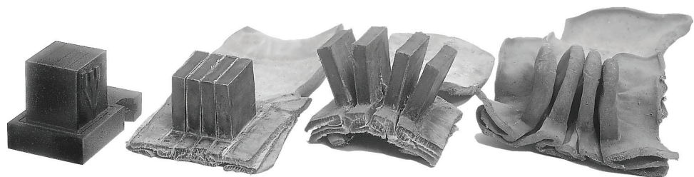
בתי תפילין של ראש בשלבי עיבוד שונים. בימינו מכינים את בתי התפילין במכשירי לחיצה, עד ליצירת מרובעים מדויקים ואחידים