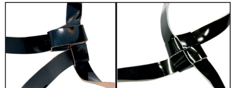
שני המנהגים הנפוצים בקשירת קשר של ראש: דלית כפולה ודלית רגילה

יד. שו"ע או"ח לגג, וְזוֹ הִיא הַהֶלְכָה שֶׁלְמֹשֶׁה מְסִינֵי. ומשום כך טוב שתהיה השחרת הרצועות לשמה, ועל ידי ישראל (שו"ע סעיף ד), ולדעת הרמ"א פסול גם בדיעבד אם לא הושחר על ידי ישראל לשמה. וְנוֹאֵי הוּא לְתִפְלִין שְׂיִהְיוּ כְּלֵן שְׂחוֹרוֹת הַקְּצִיצָה וְהַרְצוּעָה כְּלָהּ. והיום נוהגים להשחיר את הקציצה, אבל לא את הרצועות מצדן הפנימי (ב"י וד"מ). והשחרת הקציצה לדעת חלק מן הפוסקים גם היא הלכה למשה מסיני (ב"ח), אך רוב האחרונים פקפקו בכך (בה"ל). ובכל אופן לכתחילה יש לעשות את השחרת הבתים לשמה (משנ"ב).