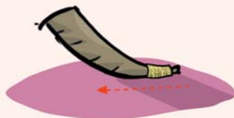
יעל - פשוט

משנה זו דנה באופן שבו היו תוקעים בשופר במקדש.